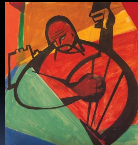
«Козак Мамай» А.Горська