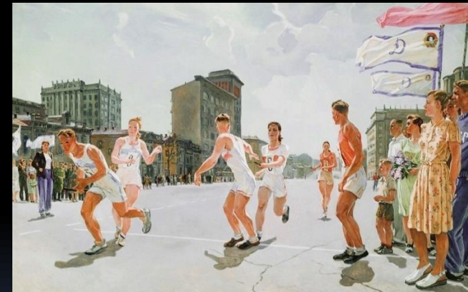
«Естафета» О.Дайнека Соцреалізм у живописі