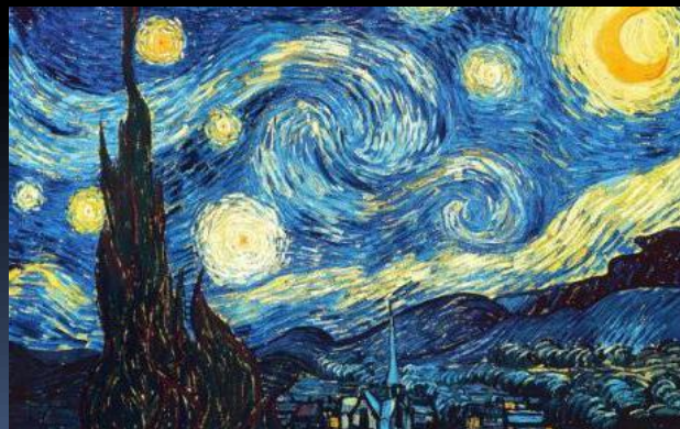
«Зоряна ніч», Ван Гог (приклад модернізму в живописі)

Модернізм виник у Франції, пов'язаний з іменами Ш. Бодлера, А. Рембо, П. Верлена, Е. Верхарна, М. Метерлінка, В. Брюсова, О. Блока, Р.-М. Рільке.